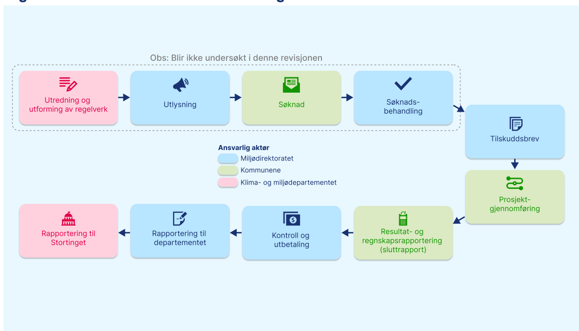
Figur 2 Prosessen i tilskuddsforvaltningen