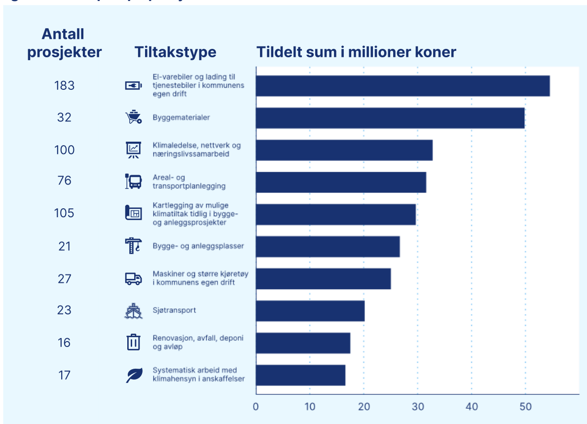
Figur 1 Eksempler på prosjekter som har fått tilskudd til klimatiltak