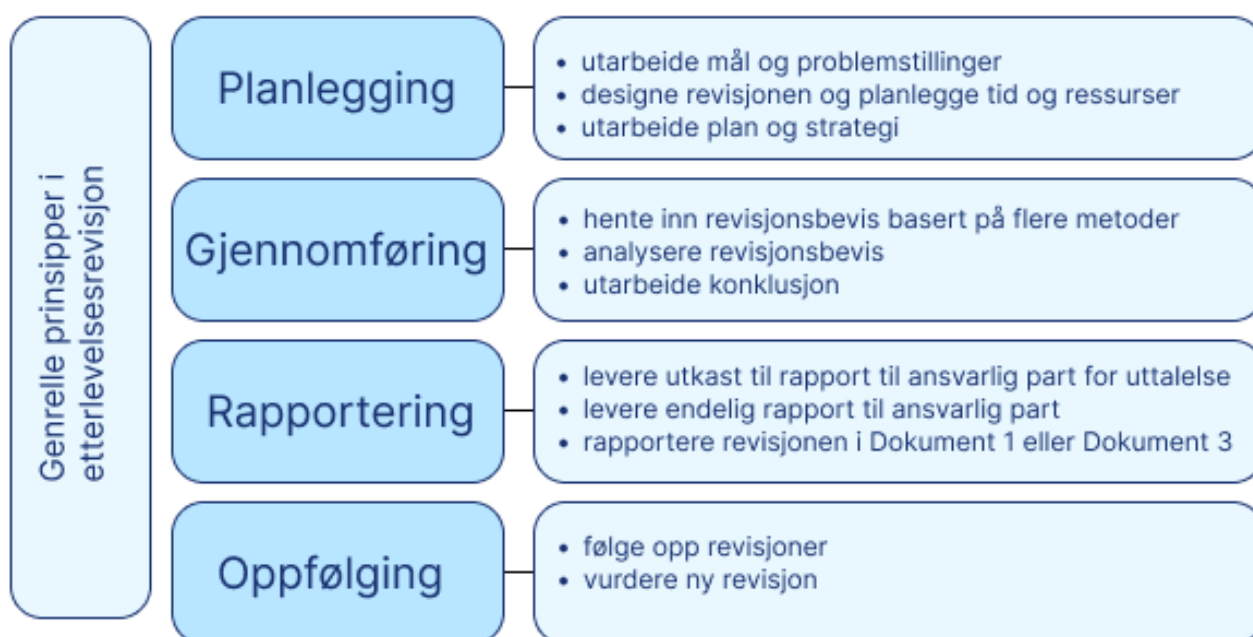
Figur 1 Revisjonsprosessen

Etterlevelsesrevisjon i Riksrevisjonen omfatter følgende faser, som samsvarer med riksrevisjonloven § 10 og ISSAI 4000: